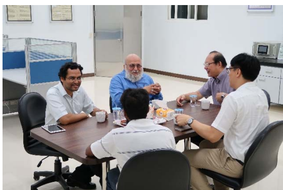
與可靠度工程研究中心成員交流研發心得