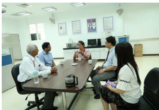
與可靠度工程研究中心成員交流研發心得