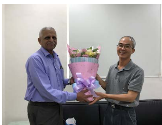
工程學院梁院長致贈鮮花與合影