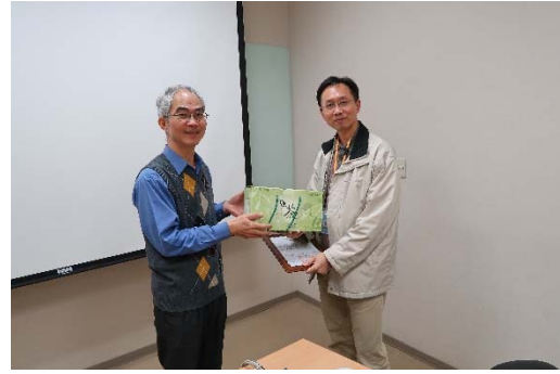
產業巡禮最後一站：(左)聯發科總部雄偉的大樓；(右)游副處長代表接受感謝狀