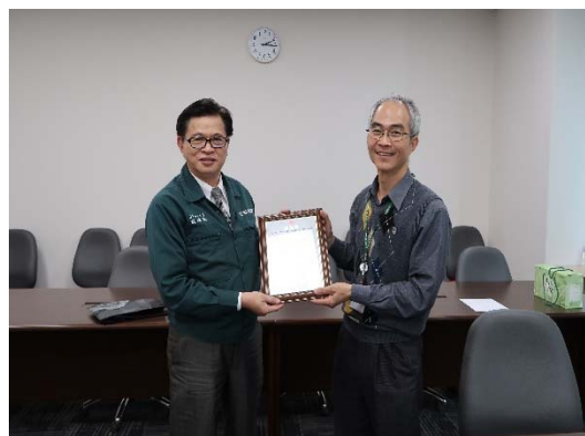
產業巡禮第三站：(左)與長榮航宇劉董事長、李總經理及現場主管交流；(右)感謝劉董事長親自接待並代表接受感謝狀